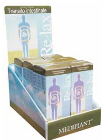
Espositore da 6 confezioni 24x35x30 cm